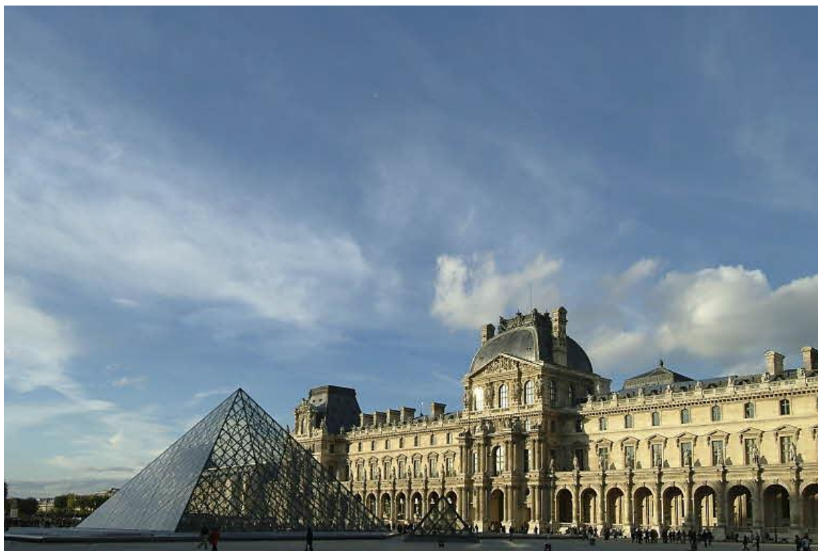
La cour Napoléon et la pyramide © 2003 Musée du Louvre / Charlie Abad, Droit d'auteur : Ieoh Ming Pei / Musée du Louvre