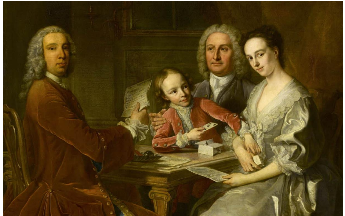
Portrait de famille, J.B. Van Loo