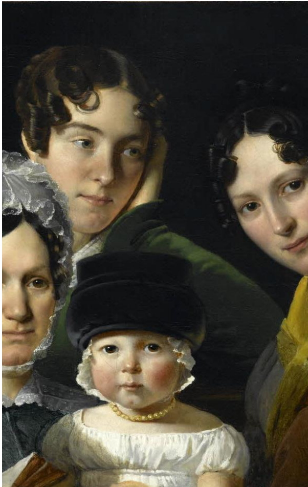
La Famille Dubufe en 1820, Claude-Marie Dubufe, © RMN - Grand Palais (Musée du Louvre) / Gérard Blot

Le Fonds de dotation du musée du Louvre vous permet de réaliser votre projet philanthropique familial dans des conditions optimales grâce :