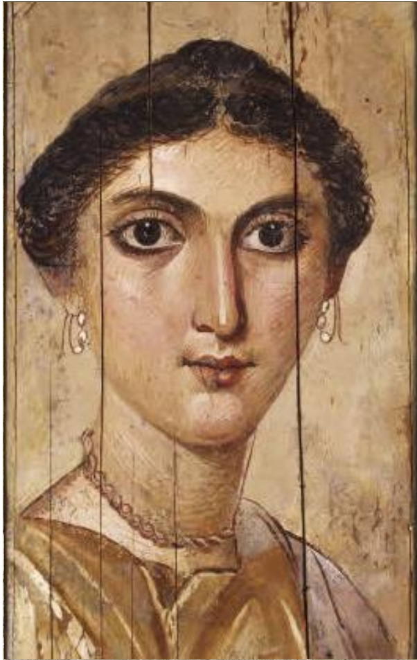
Portrait peint