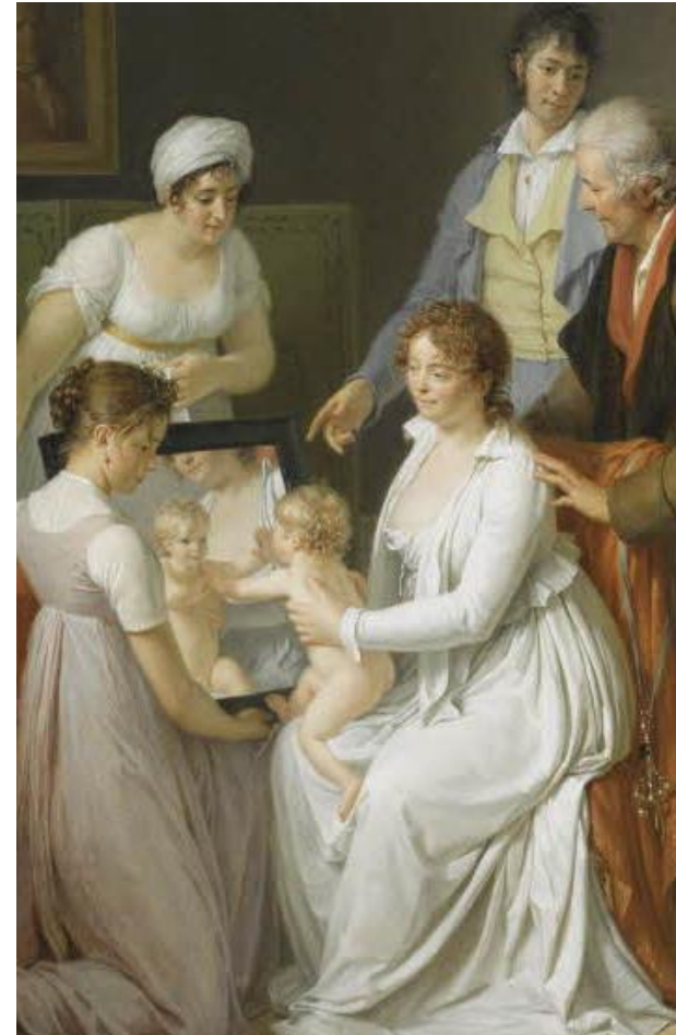
La Famille de l'artiste, J. A. Catherine Pajou

Grâce à un fonds personnalisé, vous pouvez mobiliser les nouvelles générations, fédérer différentes branches de votre famille, développer et renforcer la cohésion familiale autour d'un projet fédérateur et de valeurs communes portés par le musée du Louvre, l'un des plus anciens et des plus prestigieux musées du monde.