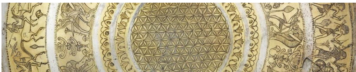
Composition du portefeuille du Fonds de dotation du Louvre au 29 décembre 2023

Le Fonds de dotation du Louvre a déployé une stratégie d'investissement responsable combinant des exclusions sectorielles et une stratégie d'impact investing dans les domaines de l'éducation, des métiers d'art et de la restauration du patrimoine bâti et naturel en France.